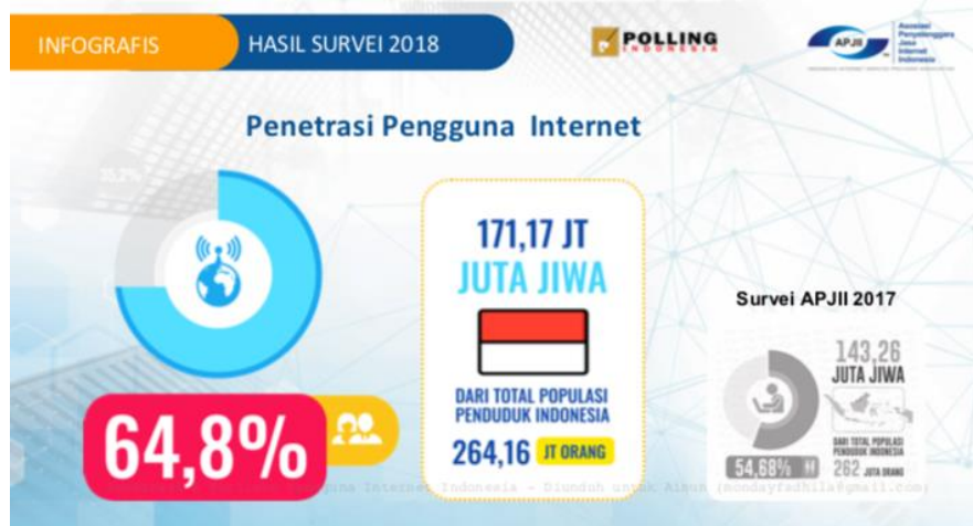
Gambar 1. Data penetrasi internet