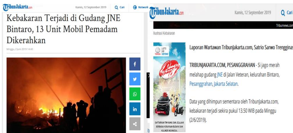
Gambar 3. Berita hoax yang diterbitkan oleh TribunJakarta