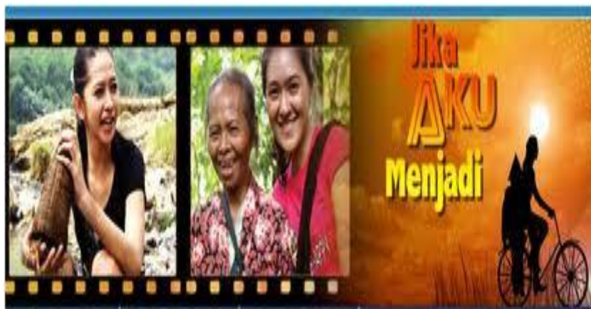
Gambar 8 Foto talent "Jika Aku Menjadi"