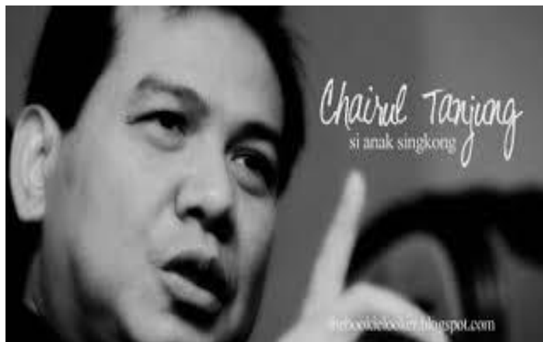
Gambar 2 Poto Chairul Tanjung