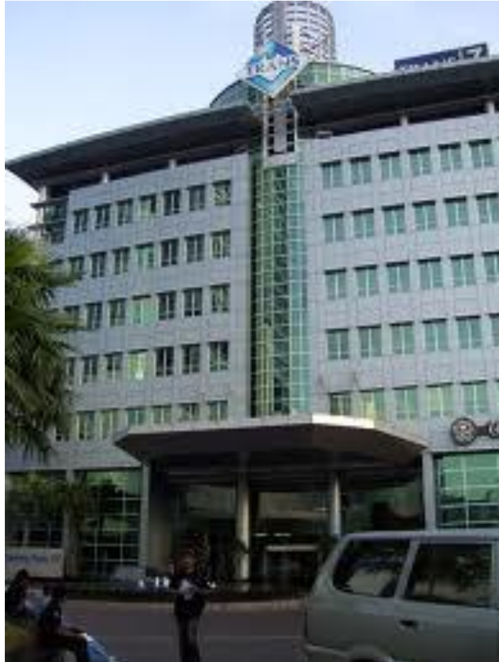
Gambar 3 Gedung Trans TV