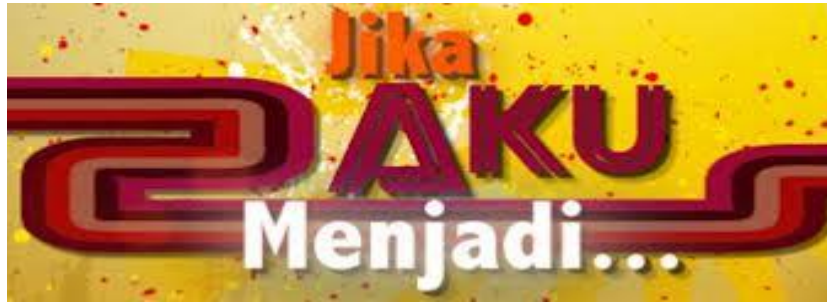
Gambar 7 Logo "Jika Aku Menjadi" 2