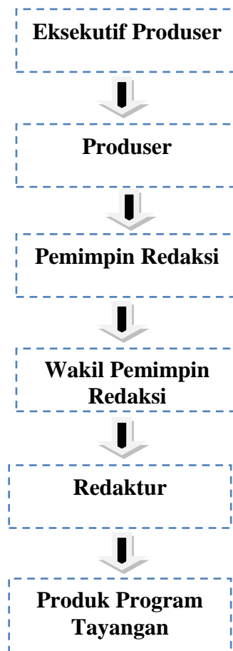
Gambar 9 Organisasi Redaksional Program “Jika Aku Menjadi” Trans TV

Berikut Update Jadwal Acara TRANS TV 2013 (1-7 Juli 2013).