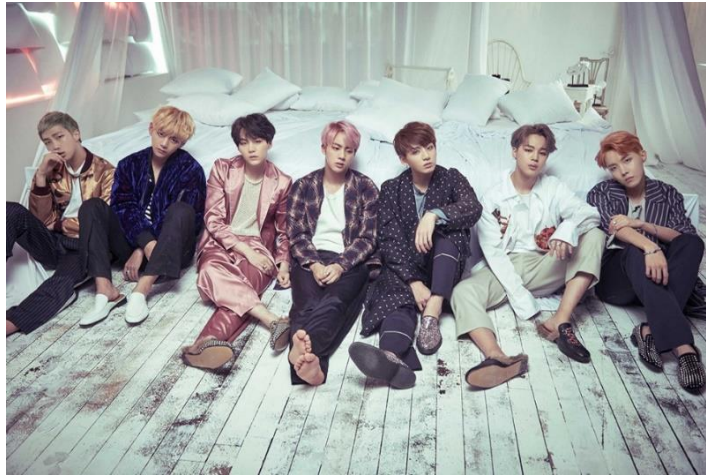
Gambar 1. BTS Era Album Wings 2016