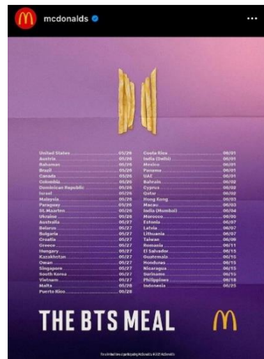
Gambar 3. Poster BTS Meal