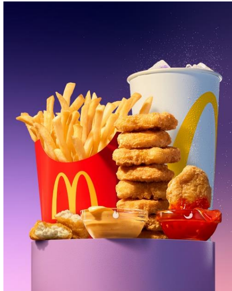
Gambar 4. Poster BTS Meal