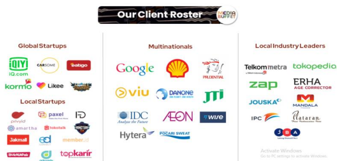
Gambar 2 Klien Media Buffet PR