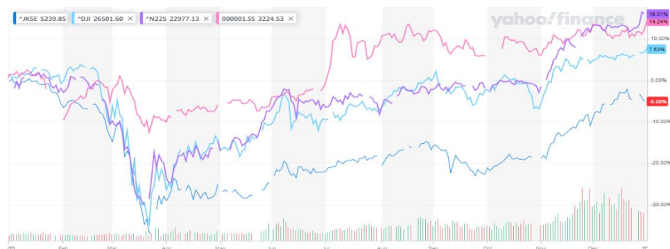
Gambar 1. Grafik Harga Harian IHSG dan Indeks Harga Saham Global Periode Januari 2020-Desember 2020

Berikut merupakan grafik data yang menyajikan informasi mengenai harga saham hariannya dalam Indeks Harga Saham Gabungan (IHSG) serta juga Indeks Harga Saham Global periode Januari 2020 hingga Desember 2020. Grafik dibawah ini menunjukkan bahwa adanya suatu perbedaan harga pada masing-masing hari selama seminggu dan juga di setiap bulan perdagangan saham.