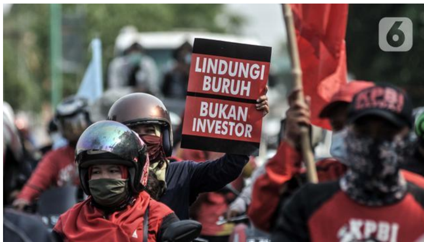
Gambar 1.1 Ilustrasi Aksi Demonstrasi UU Cipta Kerja bulan Oktober 2020

Dilansir dari Tirto (tirto.id) LBH Jakarta mengungkapkan bahwa omnibus law memberikan dampak ketidakadilan bagi masyarakat di Indonesia. Hal ini karena beberapa Pasal yang mengalami kontroversi memberikan berbagai macam dampak yang merugikan masyarakat Indonesia, khususnya bagi para buruh dan pekerja. Dampak yang dimaksud oleh LBH Jakarta ialah hak-hak pekerja dikorbankan untuk kepentingan kapital, hak-hak pekerja bagi perempuan seperti cuti haid dan melahirkan dihilangkan, penghapusan pada hak cuti bagi pekerja dan buruh, memberi dukungan pada pemberian upah murah kepada pekerja, memberi ruang terjadinya PHK (Pemutusan Hubungan Kerja) massal, dan penghapusan aturan pidana pada perburuhan/ketenagakerjaan.