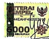
Gessy Dwi Monicaningrum