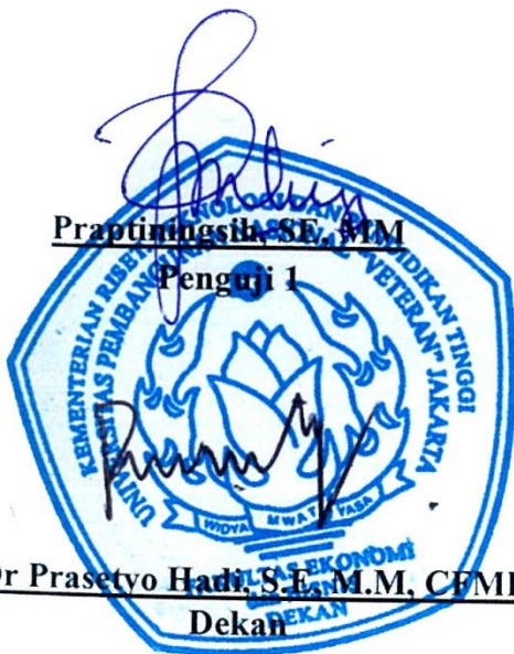
Praptiningsih, SE, MM Penguji I