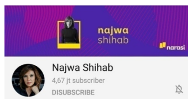
Gambar 1. Jumlah Subscribers Channel Youtube Najwa Shihab

Channel youtube Najwa Shihab yang dibawakan langsung oleh Najwa Shihab, channel yang didalamnya berisikan topic-topik politik, hukum social, religi, dan isu-isu aktual lainnya, yang dikemas lewat kemasan yang tidak sekedar menghibur, namun juga insightful. Mata Najwa, Catatan Najwa dan Shihab, Narasi Tv saat ini menjadi program yang tepat bagi mereka yang ingin selalu mendapatkan insight dari berbagai isu mutakhir di Indonesia. Najwa Shihab sempat menerima Gold Play Button dari youtube dibacara Google For Indonesia. Saat ini Channel Youtube Najwa Shihab sudah memasuki 5,04 Juta Subscribers.