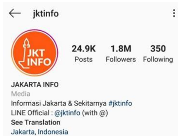
Gambar 4.2 Tampilan Akun Instagram @jktinfo