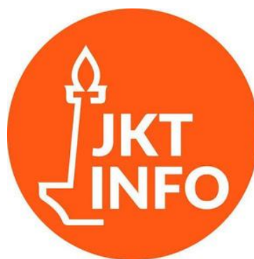
Gambar 4.1 Logo Media Sosial @jktinfo