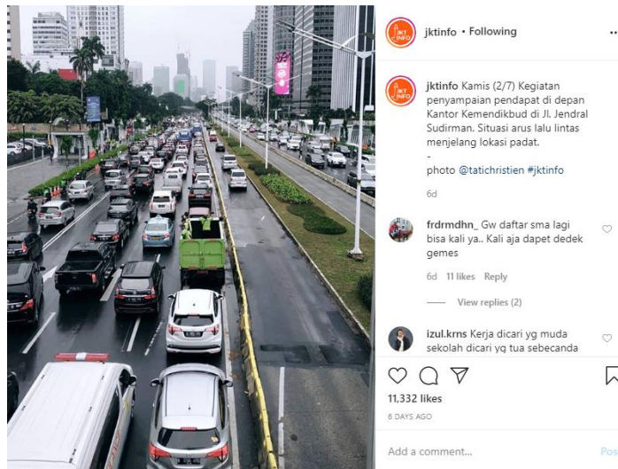
Gambar 4.3 Konten Akun Instagram @jktinfo