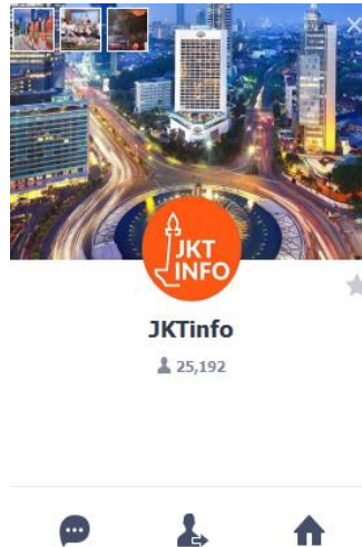
Gambar 4.5 Tampilan Beranda Official LINE @jktinfo

LINE menjadi salah satu platform media sosial @jktinfo yang digunakan untuk menyebarkan informasi. Platform Official LINE @jktinfo telah diikuti sebanyak 29.638 pengguna per tanggal 14 Oktober 2019 dan memiliki sebanyak 458 unggahan. Unggahan terakhir diunggah pada tanggal 18 November 2019. Meskipun demikian, intensitas penggunaan pada platform LINE jauh lebih rendah dibandingkan dengan Instagram @jktinfo yang setiap hari rutin menyebarkan informasi terbaru seputar kota Jakarta dan sekitarnya.