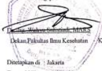
Dekan Fakultas Ilmu Kesehatan