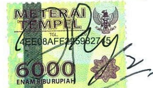
Ary Yanuar Samsudin