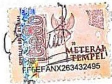
Bunga Salsabila Hidayatussalwa