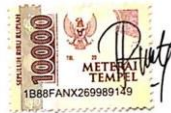
Septia Suci Rahmanti