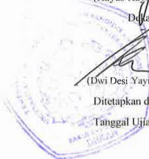
(Khoirur Rizal Lutfi, SH, MH)