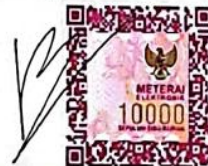
(Rio Valdo Tambun)

Dibuat di : Jakarta Pada tanggal : 6 Desember 2025 Yang menyatakan materai