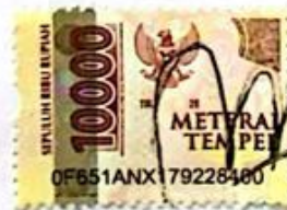
Najwa Laila Nafilaty