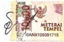
Shifa Laila Putri