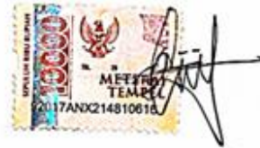
Dinda Intan Pratiwi