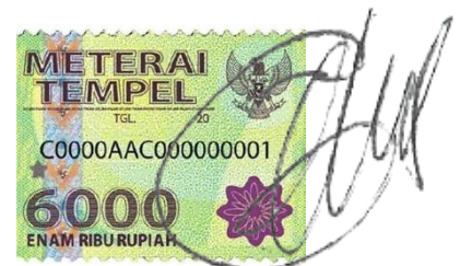
Bagus Eka Efriawan