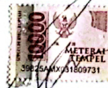
Moch. Ridho Badawi