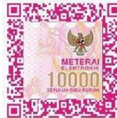
Nur Fadila Fari

Dibuat di : Jakarta Pada tanggal : 12 Desember 2024 Yang menyatakan,