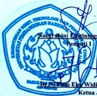
Noengrahini Praptiningsih, SE, MM Penguji I