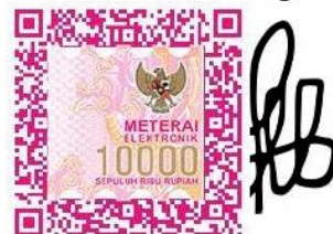
Hillform Timotius Lamhot