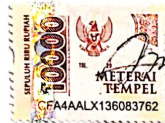
Aulia Marshanda Apsarie