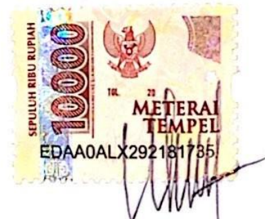
Wahyu Putri Pamungkas