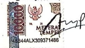
Anggara Eka Purbaya