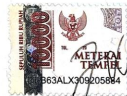
(Adisti Safa Azzahra)