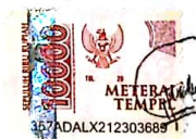
Citra Wahyu Wibowo