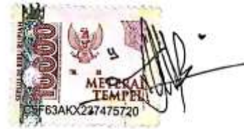
Nabila Tsamara Zahra