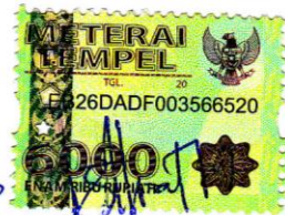
Cassandra Trivicsthra Metalika