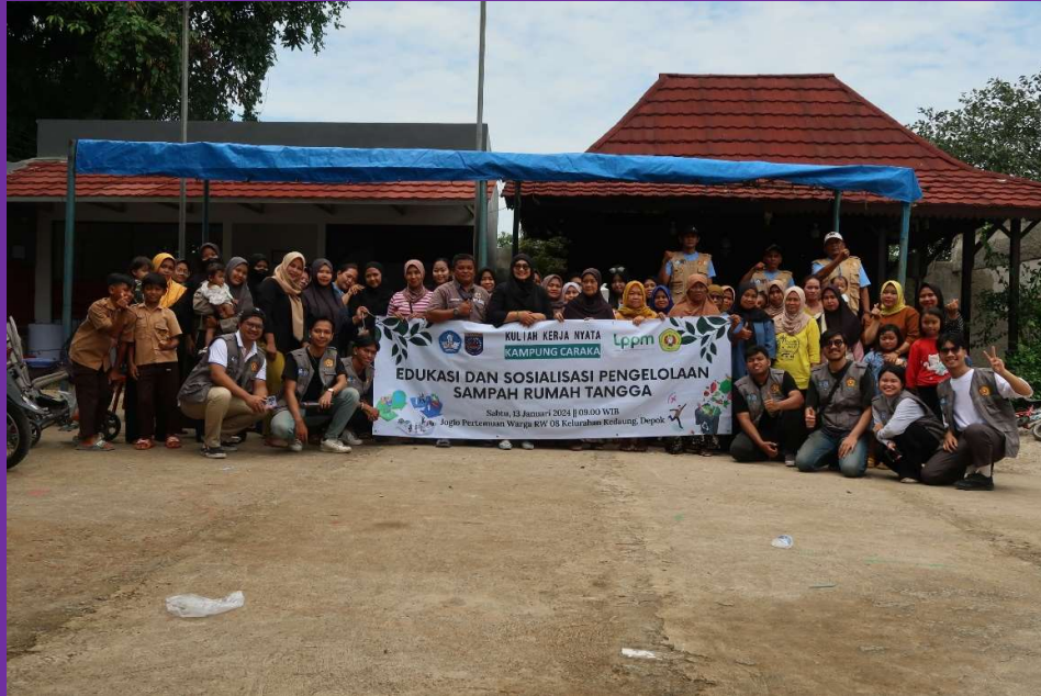
KKN Kampung Caraka 2023-2024.