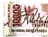
Arya bagus dwi m