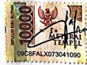
Siti Ainul Latifah