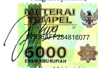
Eva Prasetio Rini