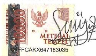
Sylvia Putri Anggraini