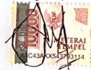
Fikri Ajie Syaputra