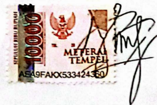
Amelia Fitria Halli