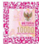
(Naufal Rafi Dzulfikar)