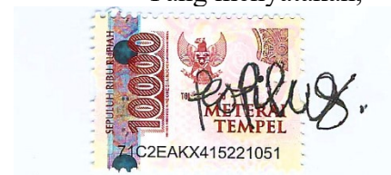
Teofilus Setia Wahyudi