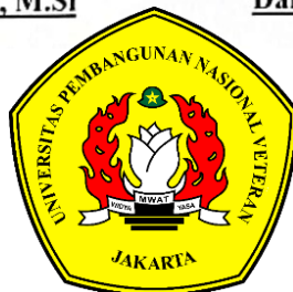
Dairatul Ma'arif, S.IP, MA.

Program Studi Hubungan Internasional Fakultas Ilmu Sosial dan Ilmu Politik Universitas Pembangunan Nasional Veteran Jakarta Tahun 2023