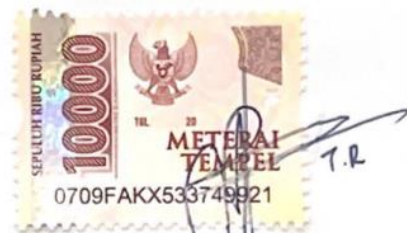
Tyara Rally Athiyyah Nabila