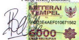
Bella Cindy Delila