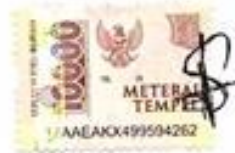
Salsa Melia Putri