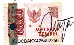
Angel Shevania Ambarita