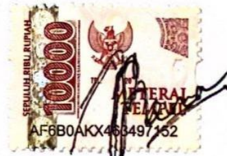
Irena Adibah Surapati