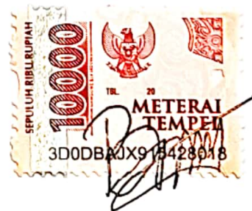
Bunga Qosimah Rasel