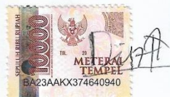
Pradipta Anugra Firdausa