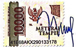
Nelvioni Devita Tupitu