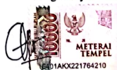
Theresia Aural Lette