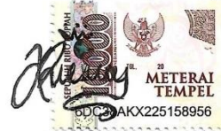
Arvy Tazkia Azzahra